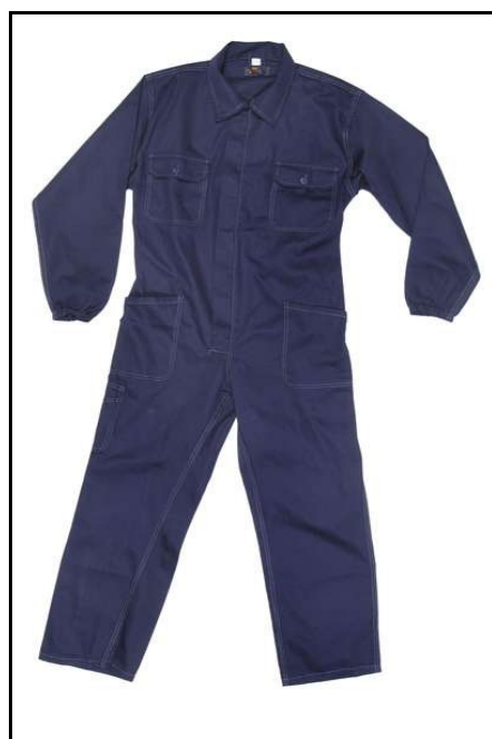
TUTA TRIVALENTE II CATEGORIA