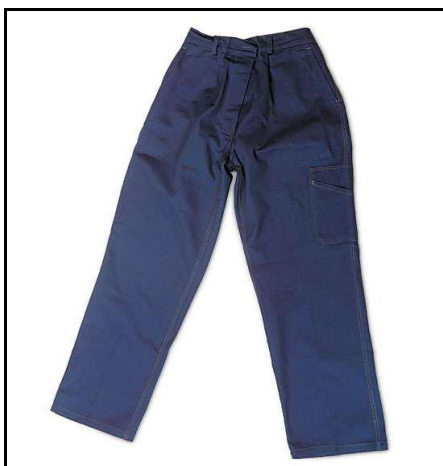
PANTALONE TRIVALENTE II CAT.