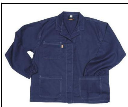
GIACCA TRIVALENTE II CATEGORIA