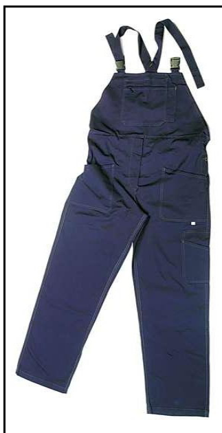
PETTORINA TRIVALENTE II CATEGORIA